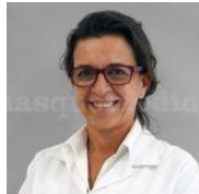
Dra. Olga Araujo Hospital Clínic de Barcelona